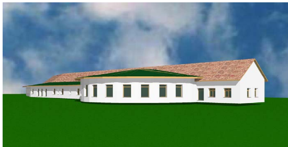
Látkép, előtérben a közösségi térrel