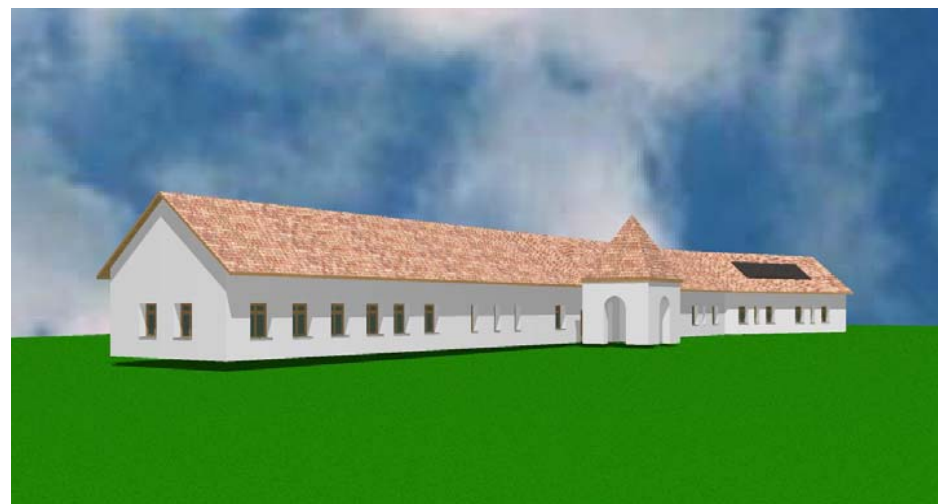
Látkép, a település felől