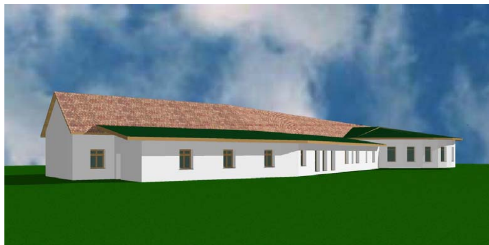
Látkép, előtérben gazdasági blokk épületrészeivel