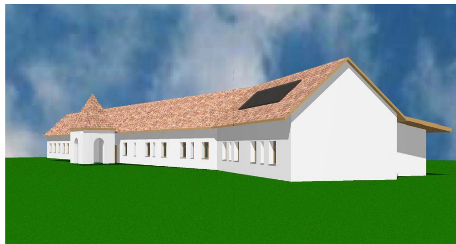
Látkép, az utca vége felől

FÉNYFOLT EGYESÜLET 9476 Zsira Locsmándi u. 8.